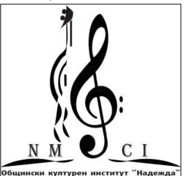
Общински културен институт „Надежда“